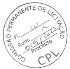
Francisco Bezerra Ribeiro Chefe do Setor de Compras

19.361.489/0001-561 IOPMED DISTRIBUIDORA LTDA-EPP Av. Getulio Vargas, 2735 Monte Castelo CEP: 65.030-000